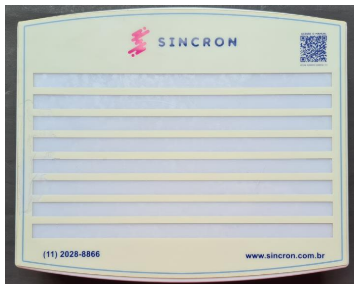
Figura 8 - Central de 64 Pontos