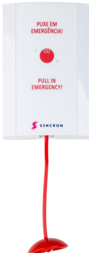
Figura 5 - Estação de Banheiro

A estação é fabricada para Fixação sobreposta em caixa 4x2 polegadas (para fixação em caixa 4x4 polegadas é preciso o acabamento cód. 15166)