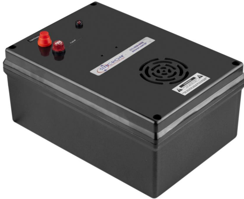
Figura 9 - Fonte 12V Chaveada

Utiliza alimentação 110/220 volts (não utiliza bateria), sua interligação é feita pelo sinaleiro, pelos fios da fonte (vermelho e preto) conectando o fio vermelho no borne do sinaleiro.