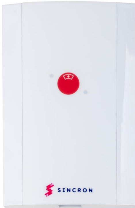
Figura 1 - Estação de Leito

A estação é fabricada para Fixação sobreposta em caixa 4x2 polegadas (para fixação em caixa 4x4 polegadas é preciso o acabamento cód. 15166)