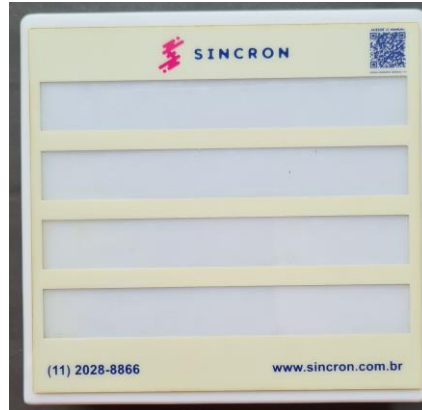
Figura 7 - Central de 20 Pontos

Para ligar a Central é necessário interligar os fios de alimentação (vermelho e preto) da fonte, sua ligação na Estação de Chamada de Banheiro e Estação de Chamada de Leito/Banheiro é feita através da interligação do fio de comunicação (roxo).