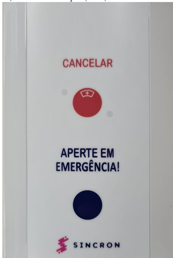
Figura 4 - Estação de Leito/Banheiro

Seu acionamento é realizado pressionando o botão de emergência azul, possui leds de identificação. Para ligar a Estação de Chamada de Banheiro é preciso interligar os fios da fonte de alimentação (vermelho e preto) e de comunicação (roxo) no sinaleiro e na central.