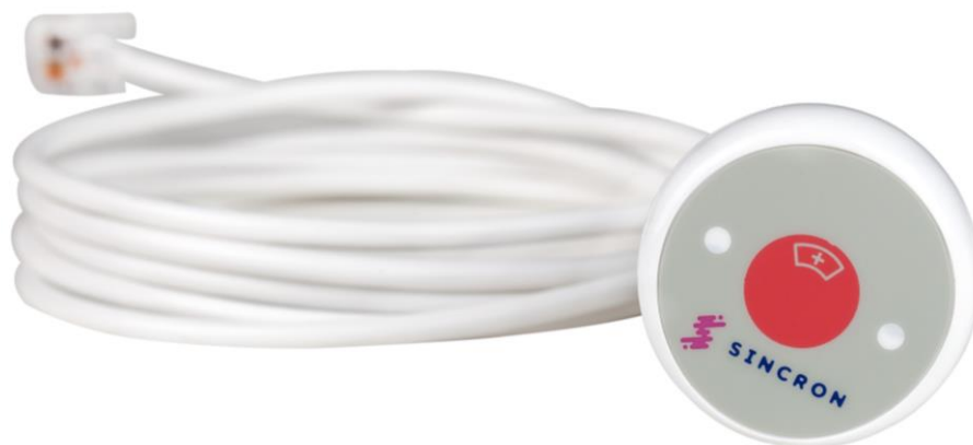
Figura 3 - Botão do Paciente

São leves, resistentes à água e possuem design anatômico. Com um simples clique, o paciente aciona a estação de leito e a central do Posto de Enfermagem. Sua ligação com a estação de leito através da conexão do RJ11 do botão na estação de leito.