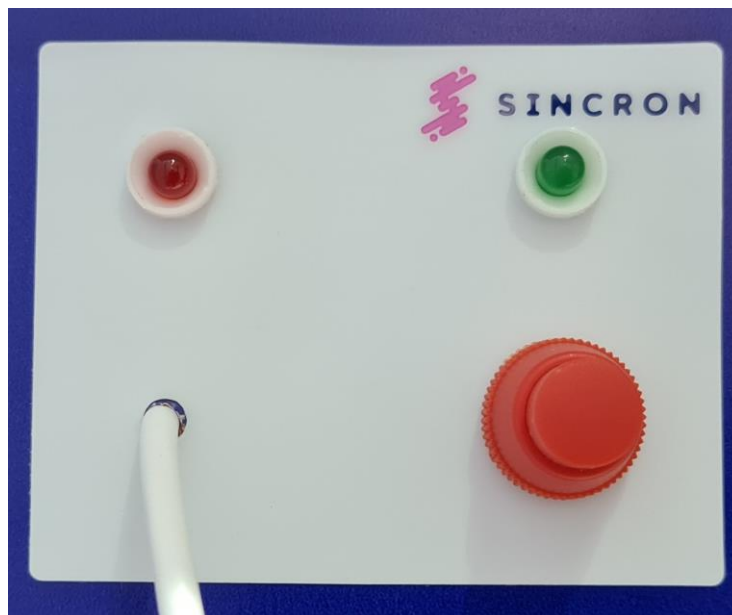
Figura 2 - Estação de Leito em Régua

Sua ligação é feita com os fios de alimentação da fonte e os fios de comunicação que são conectados no borne do sinaleiro.